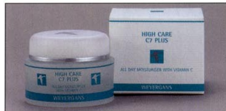
C7 plus: Moisturising day cream with vitamin C C7 plus: Feuchtigkeit spendende Tagescreme mit Vitamin C