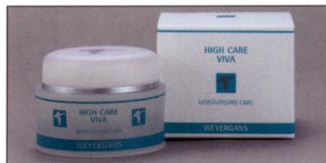
Viva: Rich moisturiser on a water/oil basis. Suitable for all times of year. Viva: Reichhaltige Feuchtigkeitspflege auf W/Ö-Basis. Für alle Jahreszeiten geeignet.